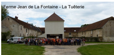
Ferme Jean de La Fontaine - La Tuèterie

Le 8 juillet 2021, jour du 400 ème anniversaire de la naissance, à Château-Thierry, de notre fabuliste Jean de La Fontaine, l'ARPSA (Association des Randonneurs Pédestres du Sud de l'Aisne) avait organisé une journée de randonnées entre la ville de Château-Thierry et la ferme historique Jean de La Fontaine à la Tuèterie. Jean de La Fontaine avait hérité de cette ferme ainsi que de la charge de Maître des Eaux et Forêts de son père. C'est dans cette ferme que Jean de La Fontaine aurait écrit ses premières fables et observé la faune sauvage.