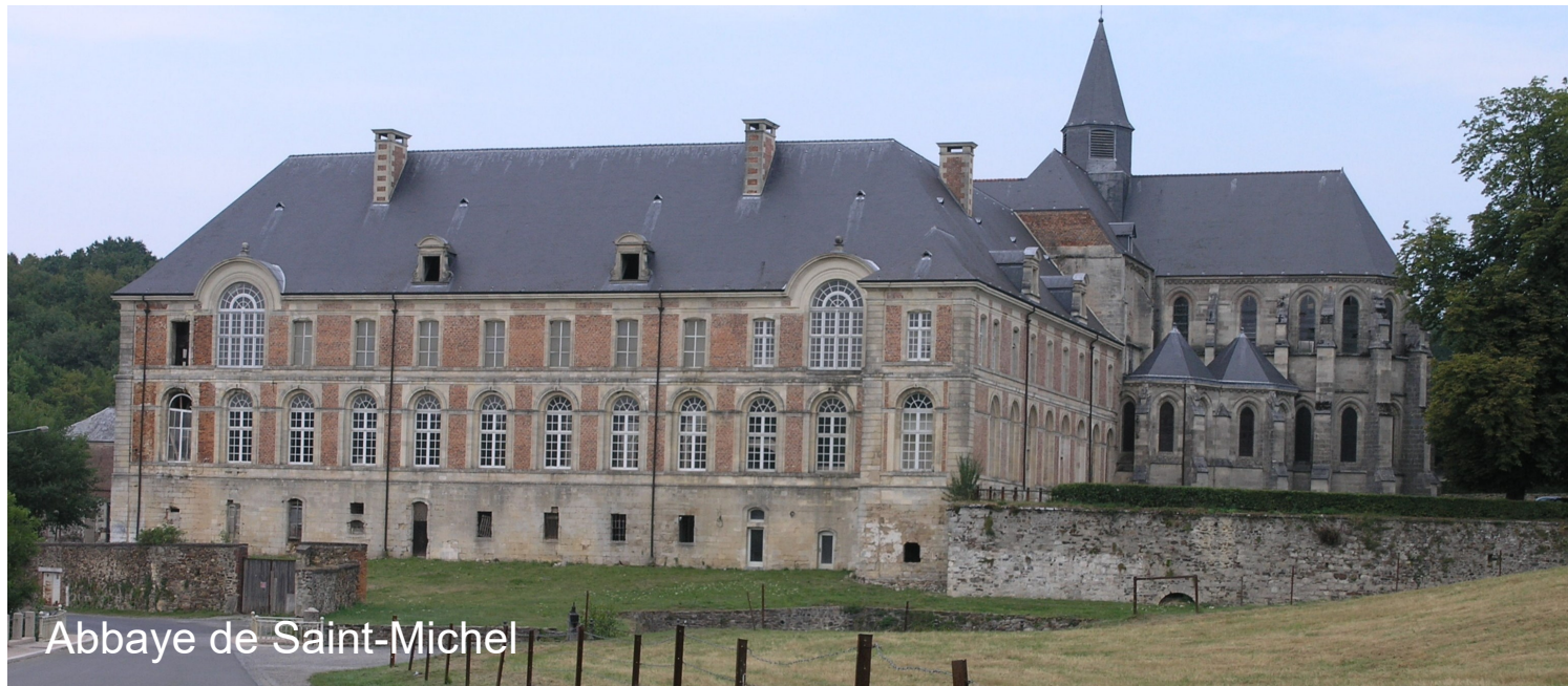
Abbaye de Saint-Michel