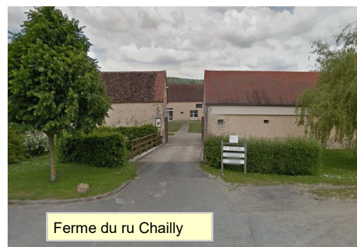
Ferme du ru Chailly