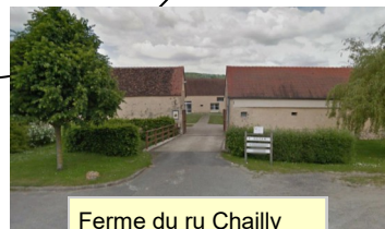
Ferme du ru Chailly